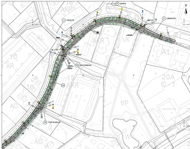
Kuva 2. Katusuunnitelmapakartta osa 2.